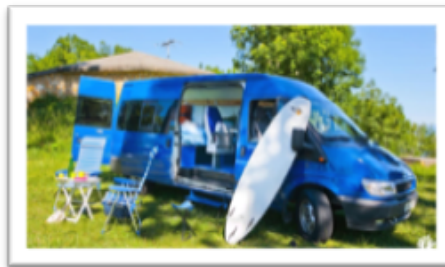
Le fourgon : tout le confort dont on a besoin sur la route