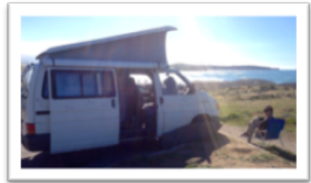
Le van aménagé : un véhicule modulable selon son voyage