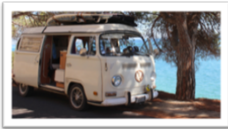
Le combi : pour une escapade à l'allure rétro ou un road trip authentique